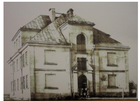
Wygląd szkoły po roku 1928