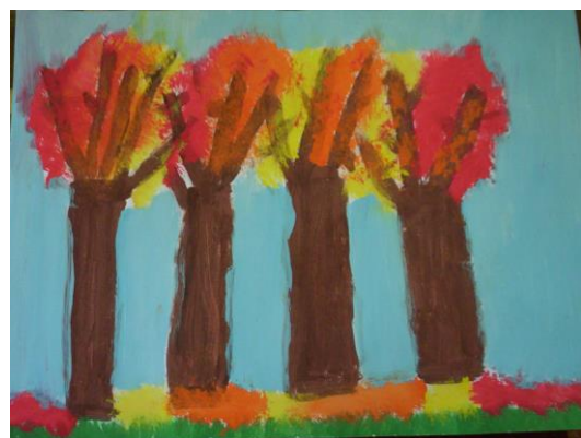
Praca Szymona Górnego