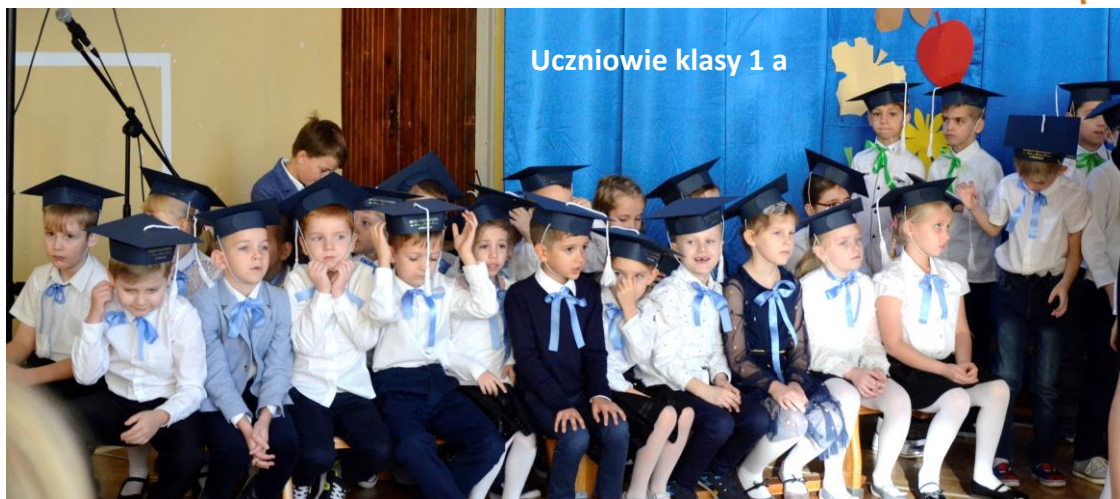
Uczniowie klasy 1 a