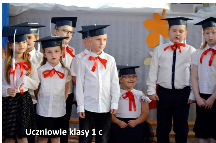
Uczniowie klasy 1 c

15 października uczniowie klas 1a, 1b, 1c zostali przyjęci do grona społeczności szkolnej. W obecności Dyrekcji szkoły, rodziców, wychowawców, nauczycieli, przybyłych gości, złożyli uroczyste ślubowanie, że będą dobrymi uczniami i Polakami.