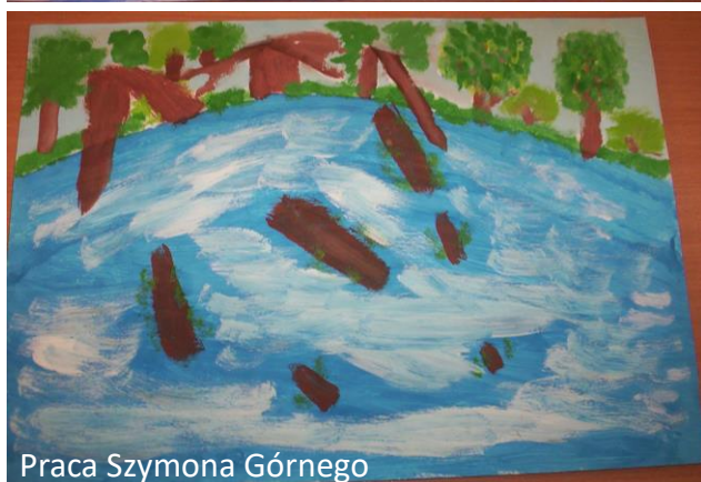
Praca Szymona Górnego