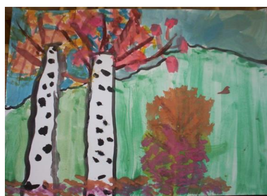
Praca Jessiki Bąk