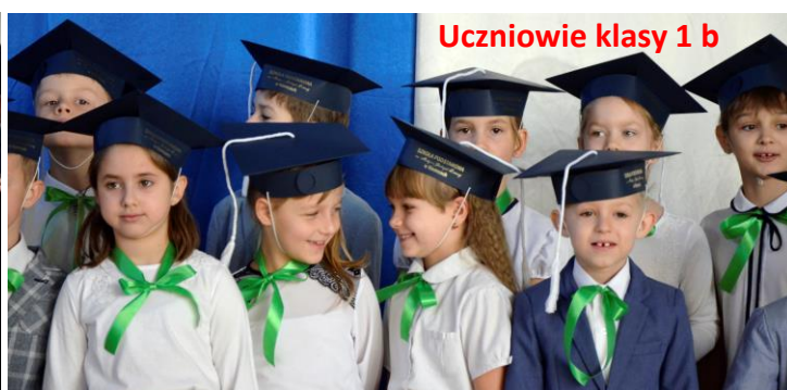
Uczniowie klasy 1 b