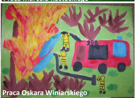
Praca Oskara Winiarskiego