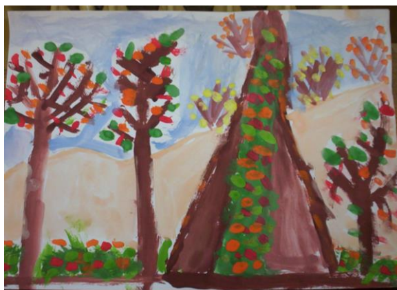
Praca Oskara Winiarskiego