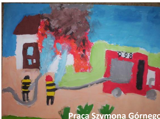
Praca Szymona Górnego