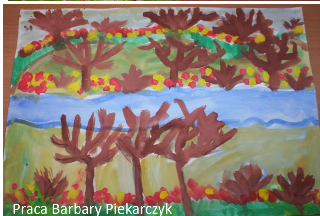
Praca Barbary Piekarczyk