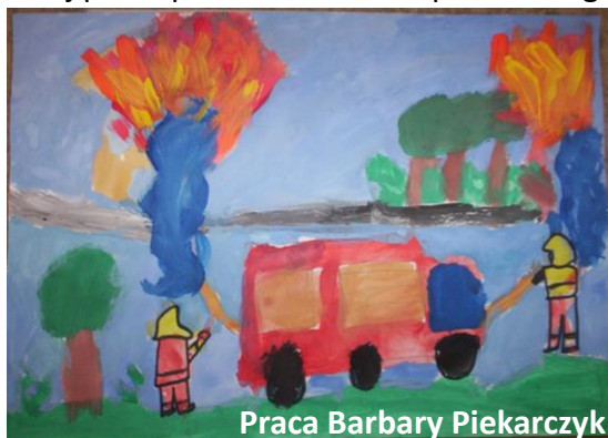
Praca Barbary Piekarczyk