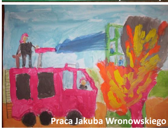
Praca Jakuba Wronowskiego