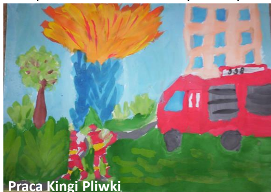
Praca Kingi Pliwki

Uczniowie kl. 1b wzięli udział w konkursie plastycznym „Zapobiegajmy pożarom”. Najpierw zapoznali się z zadaniami, które wykonują strażacy. Potem postarali się namalować niebezpieczną pracę strażaków w czasie pożarów. Organizatorem Ogólnopolskiego Konkursu Plastycznego był Oddział Wojewódzki Związku Ochotniczych Straży Pożarnych w Lublinie oraz Zespół Placówek Oświatowych w Dysie. Poniżej prace przekazane do etapu szkolnego.