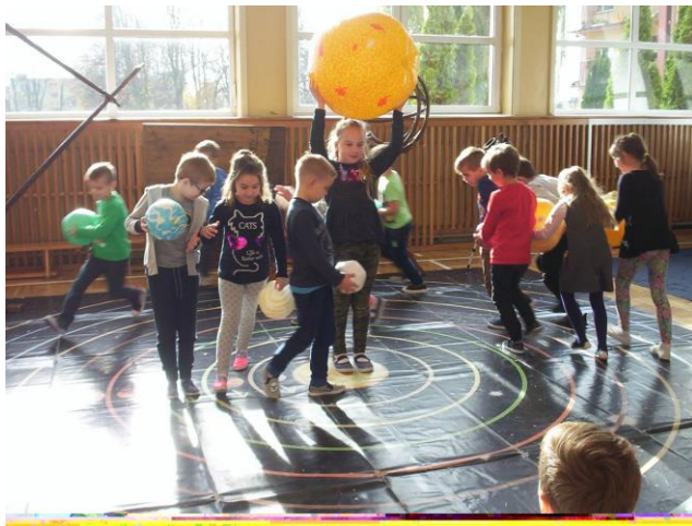
Podróże uczniów obrazujące ruch planet